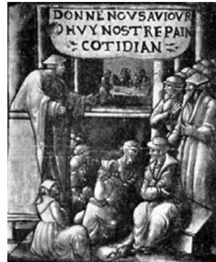
Luther, Calvin, Viret, Wyclif et Hus

Si le 31 octobre 1517, Martin Luther a pu afficher ses 95 thèses de protestation sur les portes de l'Église de Wittenberg en Saxe, c'est parce que certains avaient commencé à remettre en cause l'institution catholique romaine avant lui. Tels Pierre Valdo, John Wyclif ou bien encore Jan Hus.